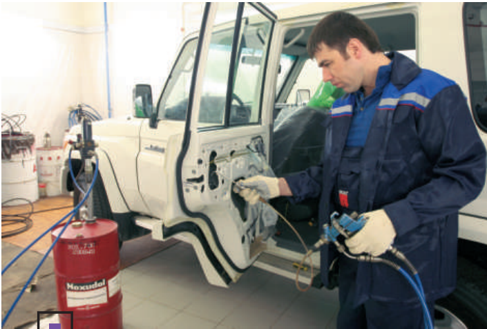
Обработка полостей дверей