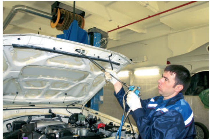
Защита полостей капота