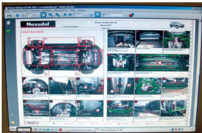
■ Технологические карты Noxudol для мастера антикоррозионного участка