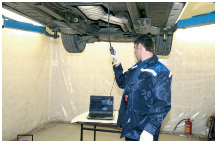
■ Диагностика полостей кузова бороскопом

— Традиционные битумные антикоррозионные препараты твердеют за счет испаре-