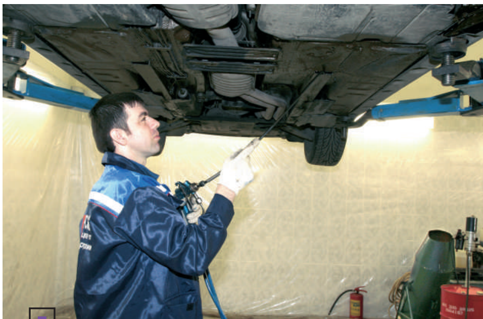
■ Обработка полостей в положении «с подъемника»

антикоррозионной обработки более чистым. Упрощаются взаимоотношения с контролирующими организациями (СЭС, пожарные службы и т. д.). Повышается товарная привлекательность обработанного автомобиля, ведь запахи и вредные испарения полностью отсутствуют.