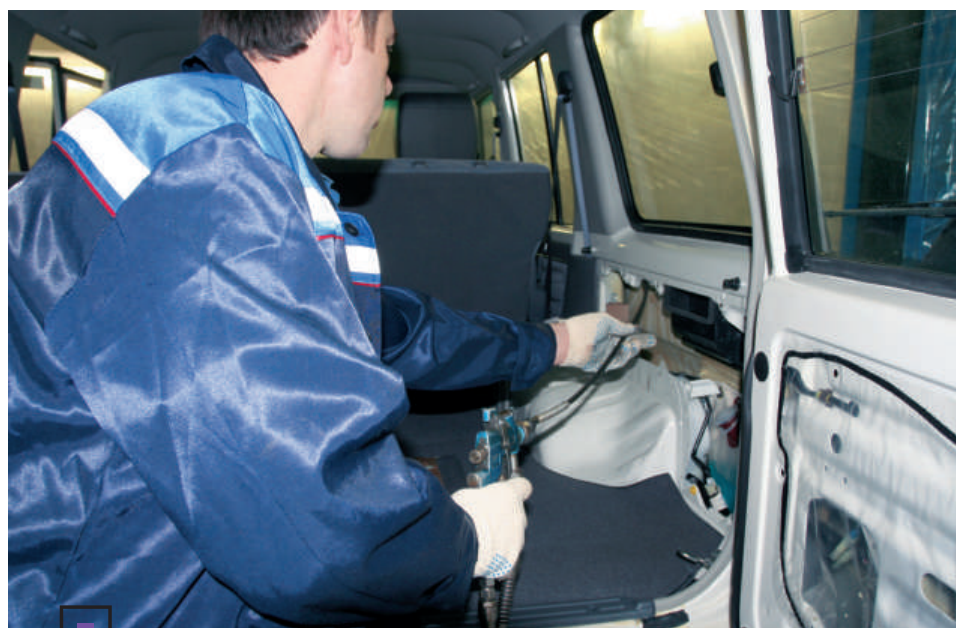
При обработке панели салона частично демонтируются

— Немало получает. Материалы Noxudol сохраняют текучесть намного дольше битумных препаратов, а потому позволяют провести более качественную обработку, обеспечивая прекрасную пенетрацию и доставку ингибиторов в любые уголки полостей. Для надежной защиты днища достаточно пленки толщиной 150 мкм. В дальнейшем пленка остается неизменной и дольше сохраняет защитные свойства. Кроме того, на обработанной поверхности остается весь нанесенный материал. В то время как в битумных препаратах сухой остаток составляет 50–60%. Значит, Noxudol делает участок