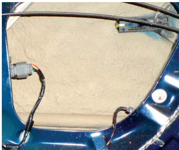
Фактура пленки Noxudol 3100 (внутренняя защита)